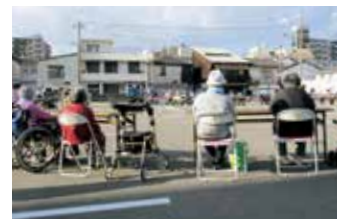
吉野グループ秋季運動会

新年あけましておめでとうございます。昨年中は皆様からの格別のご高配を賜り、つつがなく過ごせましたことご報告申し上げます。サ高住よしのでは感染予防に十分留意したうえで昨年秋より積極的に行事に参加し、地域との交流をすすめています。10月には吉野グループ秋季運動会、11月には美須賀コミュニティプラザ文化祭にデイ利用者様の作品を出展させて頂きました。ご家族様や地域住民の方との触れ合いが入居者様の生活に彩りと張り合いをもたらしていることは想像に難くありません。当施設では今後とも入居者様が健康かつ安全に暮らせるようなお一層の努力を重ねて参りたいと思います。本年もどうぞよろしくお願ひ申し上げます。