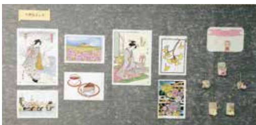
塗り絵とアロマ入りオブジェ