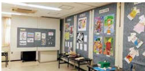
美須賀コミュニティプラザ文化祭