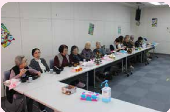
楽しいダンスに利用者の皆さんも大喜び