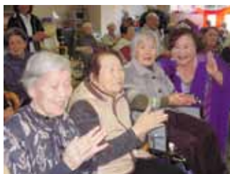
歌謡ショー也大盛り上がり