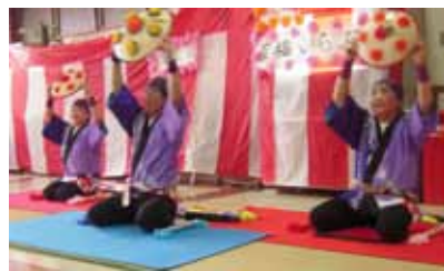
百福クラブさんの楽しい演芸